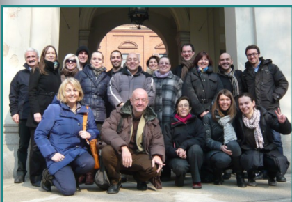
Οι συνεργάτες του DANTE στην εναρκτήρια συνάντηση (Τορίνο, Ιταλία)