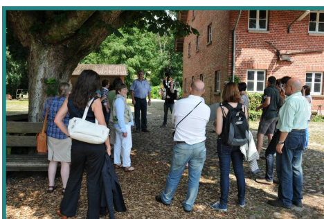
Επίσκεψη των συνεργατών σε μία φάρμα.

Τα αποτελέσματα αυτής της προσέγγισης είναι ιδιαίτερα επιτυχημένα. Τα μέλη του Συνεταιρισμού εμφάνισαν συνολικά 820.000 νύχτες διαμονής στο Niedersachsen, με άμεσο όφελος ετήσιο τζίρο 42 εκατ. ευρώ και έμμεσο όφελος 25 εκατ. ευρώ.