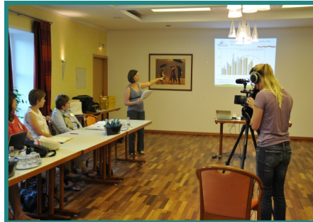
Συνάντηση DANTE, Γερμανία, Ιούλιος 2012

θούν στρατηγικές αποφάσεις ή να αναπτυχθούν πολιτικές.