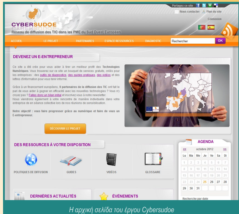
Η αρχική σελίδα του έργου Cybersudoe

http://www.cybersudoe.eu/ http://www.euromontana.org/