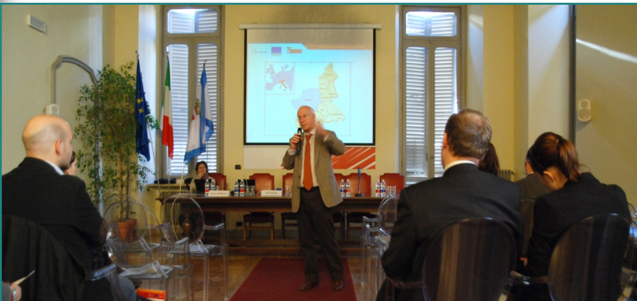
Εισαγωγή από τον Δρ. Ugo Perone, Σύμβουλο Πολιτικών Τουρισμού και Πολιτισμού, Επαρχία Τορίνο