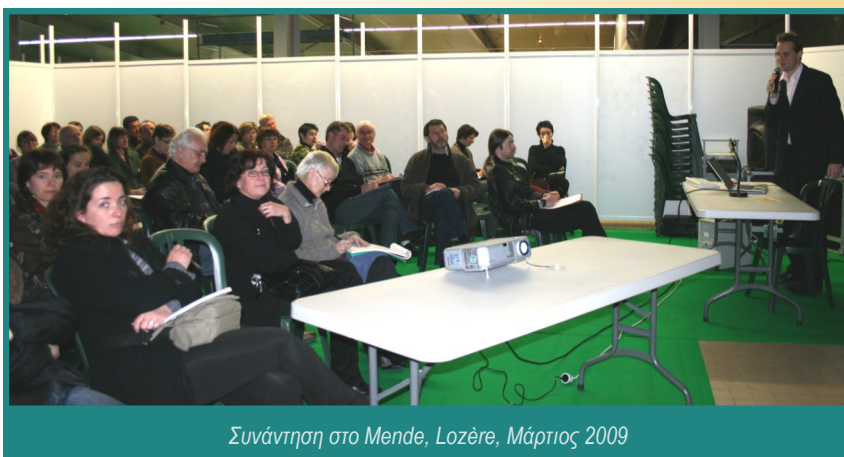
Συνάντηση στο Mende, Lozère, Μάρτιος 2009

Το έργο Tourisma'ICT υλοποιήθηκε από το Cybermassif στο Massif Central της Γαλλίας