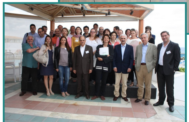
DANTE workshop in Crete, May 2012